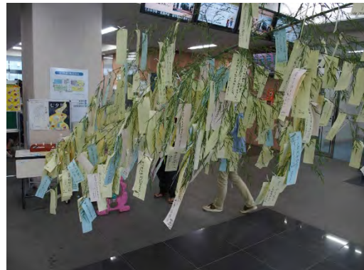
あっという間に短冊が