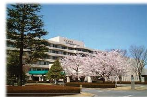
北里大学メディカルセンター