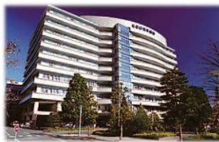
北里大学北里研究所病院