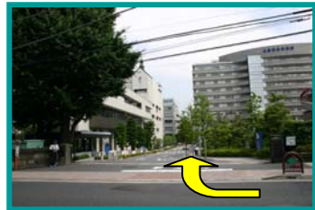
⑧正門に入った右建物が病院