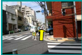
⑤ひたすら道に沿って歩きます。