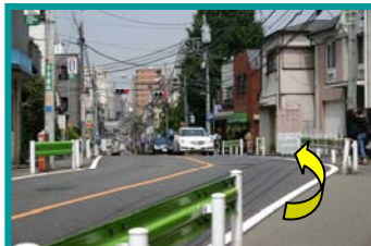
⑦あと約50mで正門が右側に