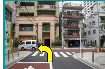
③つきあたりを左折