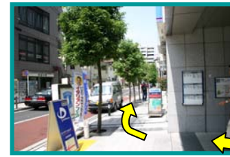
①白金高輪駅出口を右へ