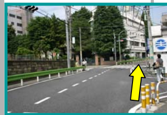
⑥道なりにまっすぐ進みます