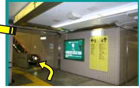
(はじめに) 3番出口へ