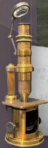
フランス製 Nacet の ドラム型顕微鏡 19世紀