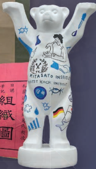
コッホ研究所より贈られた Buddy Bear 2024年