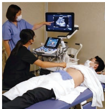
超音波検査を体験

栄養相談の体験を、医療ソーシャルワーカーは患者さん本人やご家族の社会的支援を行う仕事について体験しました。超音波検査体験では実際の超音波検査装置