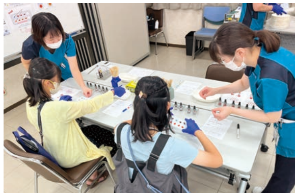
血液型検査を体験