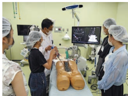
整形外科ナビゲーションを体験

続いて、8月24日には将来医師を志望する中学生が「フューチャードクターセミナー」に参加しました。メディカルセミナー同様、募集もなく定員に達する人気ぶりです。はじめは緊張していた中学生たちも自分たちの手を動かし体験するごとに感動の声や笑顔が見られるようになりました。