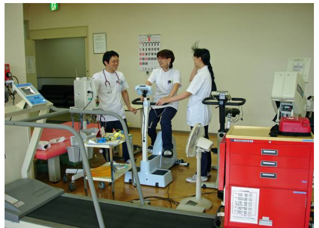
心臓リハビリテーション

受診希望の場合には、かかりつけ医の紹介状をご持参していただき、新患・初診受付まで午前8時半から11時までご来院下さい。