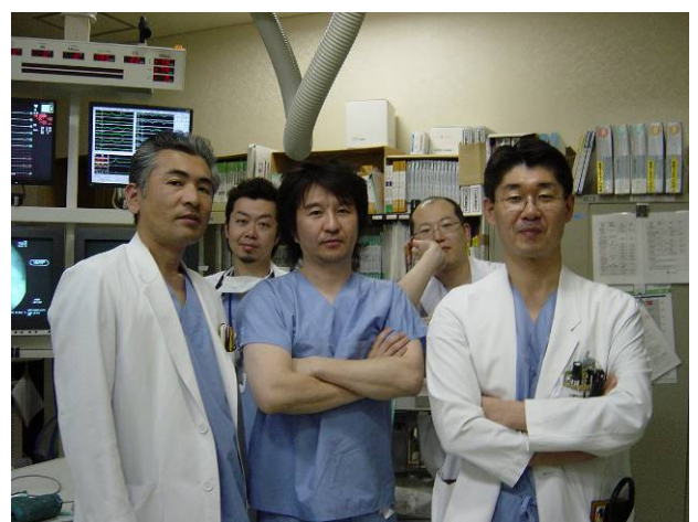
循環器科チームスタッフ