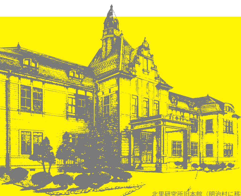
北里研究所旧本館 (明治村に移築保存)