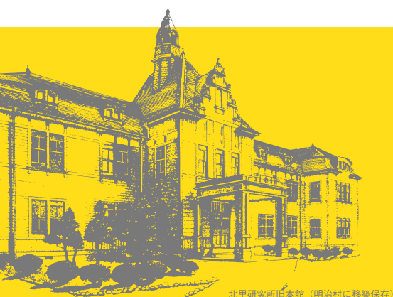
北里研究所旧本館 (明治村に移築保存)