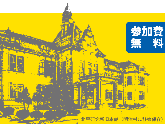
北里研究所旧本館 (明治村に移築保存)